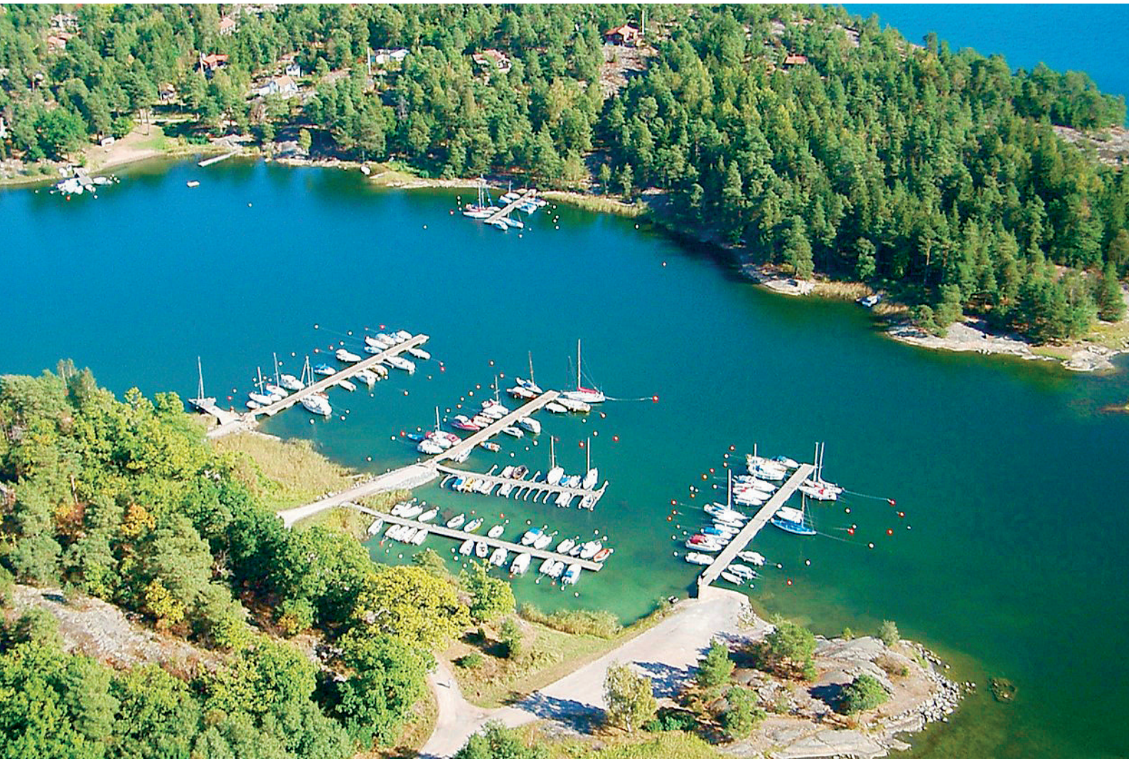
▲ Södra delen av Älvsalaviken i Stockholms skärgård – ett typiskt exempel på en skyddad vik där båtar och bryggor breder ut sig.

är beroende av klart vatten är de extra känsliga för den uppgrumling som båtar kan orsaka.