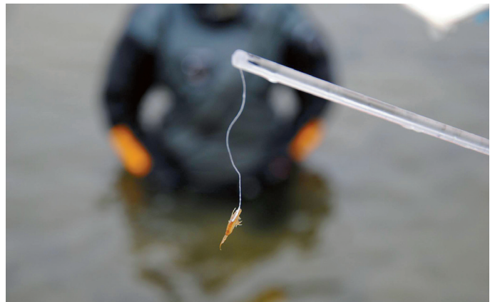
▲ För att undersöka betningstrycket på botten djur sattes det ut små pinnar med levande gammarus fastlimmade på en tunn lina som sedan räknades en gång i timmen.

En stor del av 2017 års verksamhet inom ramen för projektet Refisk har bestått av en utvärdering av dessa fred-