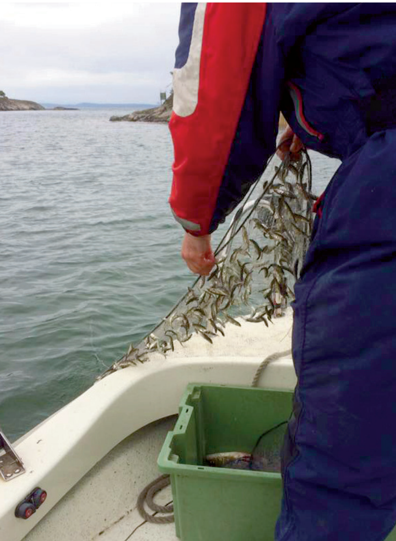
▲ I Stockholmsvikarna genomfördes även provfiske med översiktsnät. Där rovfisk, som exempelvis gädda, saknades kunde det vara stora mängder småfisk som har en negativ påverkan på miljön. I detta fall storspigg som kunde förekomma i mycket stora mängder.

heten. Fisket utgörs i princip enbart av handredskapsfiske. För att fiskereglerna ska gälla alla måste de införas i Havs- och vattenmyndighetens författningssamling. De regler som kan komma att ändras är minimimått och maximimått, fångst- och redskapsbegränsningar, fredningstider och fredningsområden. Målet är att bidra till en mer hållbar fiskeförvaltning för området.