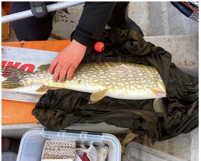
▲ Inom Refisk har det märkts närmare 500 gäddor för att få reda på mer om hur de rör sig. Den som fångar och rapporterar flest märkta gäddor vinner ett fint pris.

ningsområden. Har de gett resultat i form av mer fisk? Och har ekosystemet i de fredade vikarna påverkats? Samtidigt har det varit viktigt att fortsätta det lyckosamma förankringsarbetet, och få med alla intressenter i diskussionerna. Två informationsfilmer har spelats in och många möten har hållits för att diskutera möjliga regelförändringar.